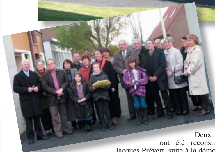
Deux nouvelles classes ont été reconstruites à l'Ecole Jacques Prévert, suite à la démolition des classes en préfabriqué.

Elles sont opérationnelles depuis le 5 novembre 2009 et ont été inaugurées le 1er décembre dernier. Ces classes font partie du « Groupe Scolaire Jacques Prévert et Marie Curie », nouvelle entité scolaire, suite à la fusion des deux écoles élémentaires.