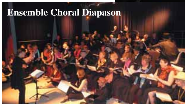
Ensemble Choral Diapason