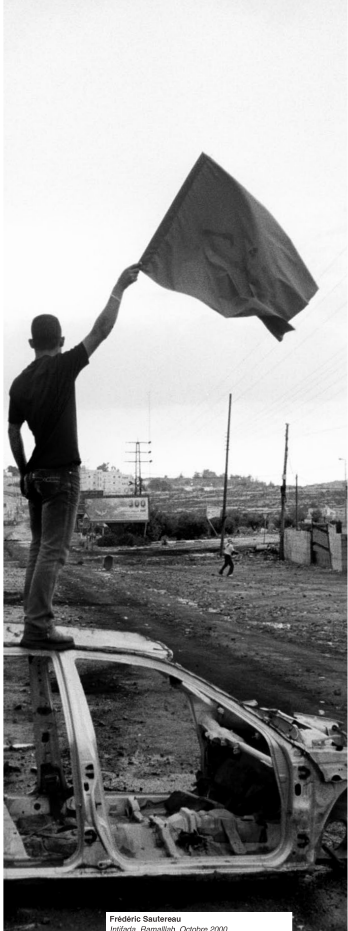
Frédéric Sautereau Intifada. Ramallah. Octobre 2000.