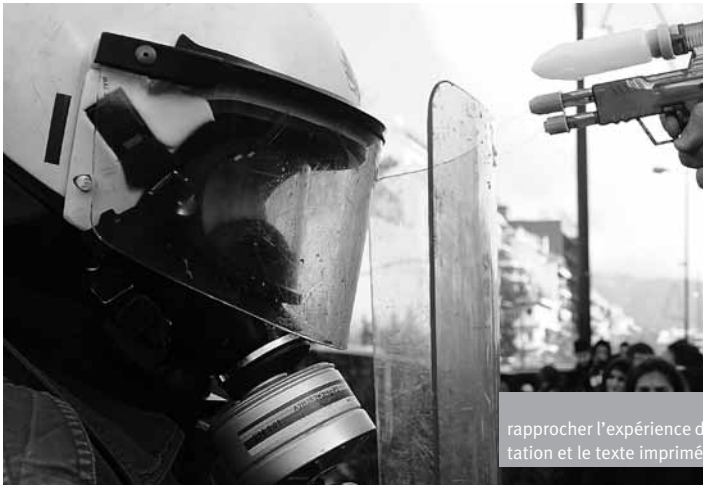
rapprocher l'expérience de la représentation et le texte imprimé