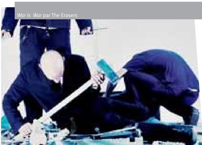
War is War par The Erasers