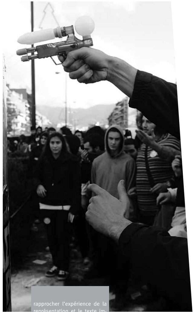
rapprocher l'expérience de la représentation et le texte imprimé