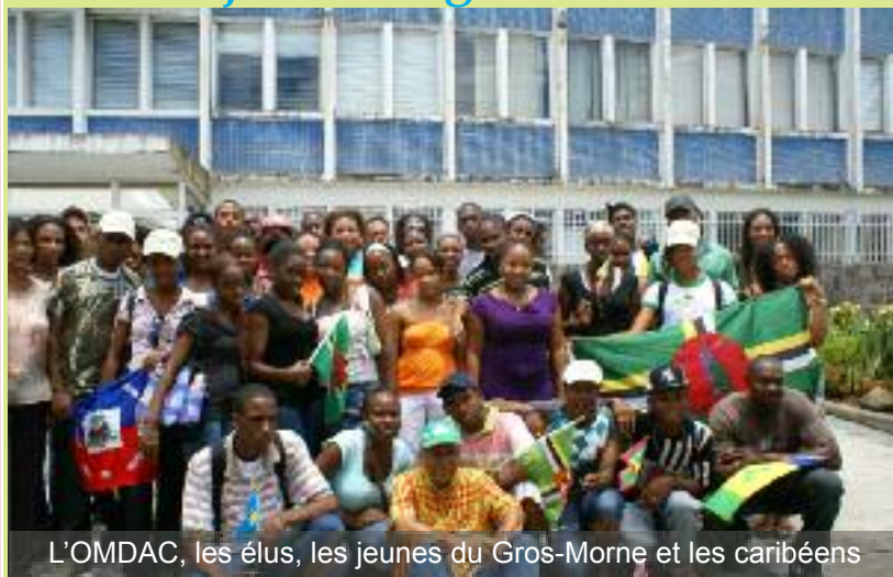
L'OMDAC, les élus, les jeunes du Gros-Morne et les caribéens

a accueilli une centaine de jeunes de toute la Caraïbe : Sainte-Lucie, Saint-Vincent, Dominique, Grenade, Guadeloupe, Haïti, Saints-Kitts... étaient au rendez-vous. Cette rencontre a été organisée par une vingtaine de jeunes Gros-mornais. Elle a permis dans un premier temps, de découvrir à travers une exposition, les pays de la caraïbe. Au stand du Gros-Morne, nos hôtes ont mis l'accent sur les artisans de la Commune et les productions locales.