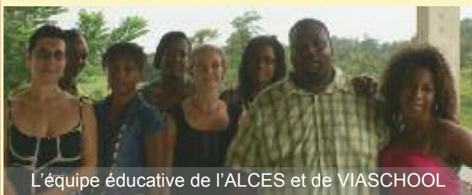
L'équipe éducative de l'ALCES et de VIASCHOOL

Quand il s'agit d'aider les jeunes à mieux réussir leur scolarité, des volontés se rencontrent autour d'un même objectif : Contribuer à l'épanouissement de l'enfant.