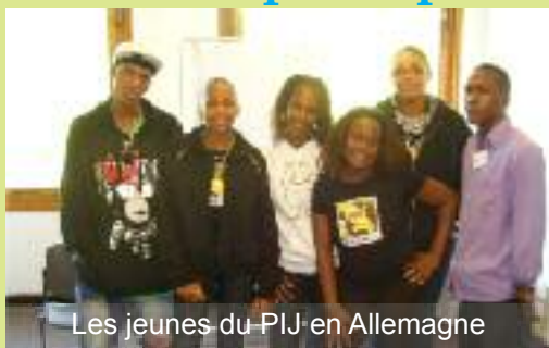
Les jeunes du-PIJ en Allemagne

Dix jeunes gros-mornais ont participé au programme européen "Débat : le gender main streaming" initié par l'Allemagne. Ce débat tricontinental (Afrique, Europe, Amérique) s'est articulé autour de la notion de sexe social (gender), de sa conception culturelle et de la problématique de l'égalité des genres. Du 27 août au 9 septembre 2009, nos jeunes gros-mornais ont rencontré en Allemagne d'autres jeunes du Mozambique, du Sénégal, du Burkina Fasso, de la France hexagonale et de l'Allemagne. Ils se sont préparés pour ce rendez-