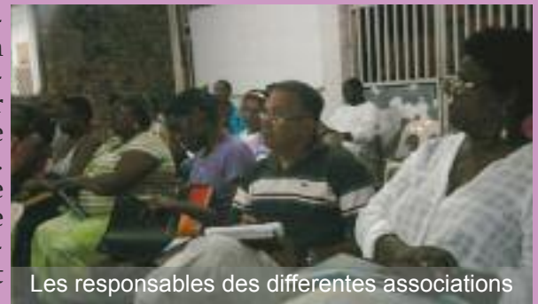
Les responsables des différentes associations

un chacun de s'exprimer. Des propositions ont aussi été faites par les présidents. La mise en place d'un livret informatif à destination des associations est un exemple. Cette rencontre a été fort utile. Elle a permis de faire le point sur les festivités de fin d'année et d'apporter des informations sur la collaboration future entre la Municipalité et les associations de la Commune.