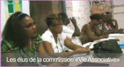
Les élus de la commission « Vie Associative »

L e lundi 21 septembre, le Maire et les commissions « fêtes et cérémonies » et « sports et vie associative » ont organisé une réunion d'information et d'échange avec les associations de la commune. Le but était de faire un point sur la sécurité, prévoir les manifestations pour la fin d'année, informer sur la participation de la Mairie aux manifestations organisées par les associations et faire une projection sur le fonctionnement des associations à partir de 2010.