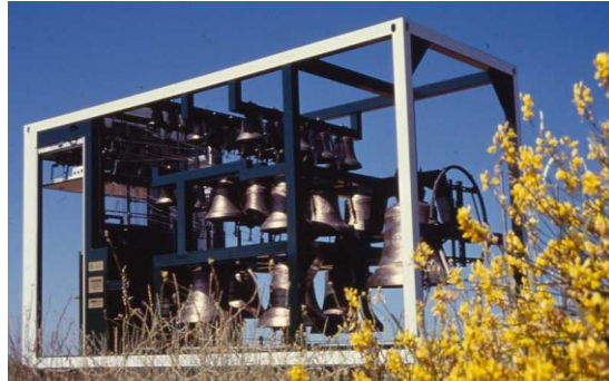
le premier carillon ambulant de Douai

Après 23 années de pérégrination, fragilisé, ce premier carillon sera réformé. Il a effectué son dernier voyage pour se rendre à Dordrecht en Hollande où ses cloches devraient être installées dans le campanile de l'hôtel de ville.