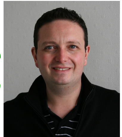
34 ans, agent territorial de communication municipale et militant d'éducation populaire

Candidat aux élections régionales en 15ème position sur la liste du Pas-de-Calais Secrétaire adjoint de la section PCF de Carvin