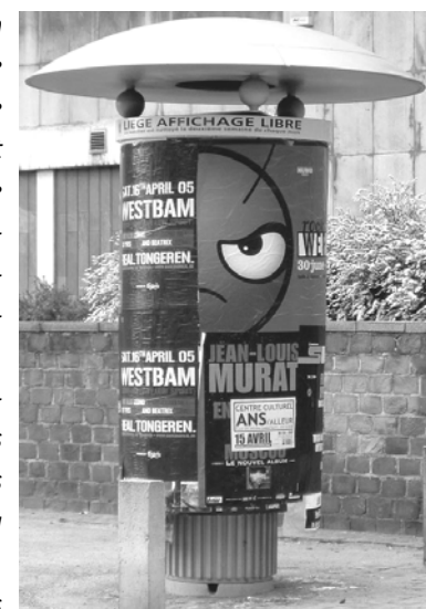
Les colonnes « Morris » ont disparu du paysage carvinois... Et rien pour les remplacer !

M. le Maire, parvenu « au pouvoir » craindrait-il la liberté d'expression ?