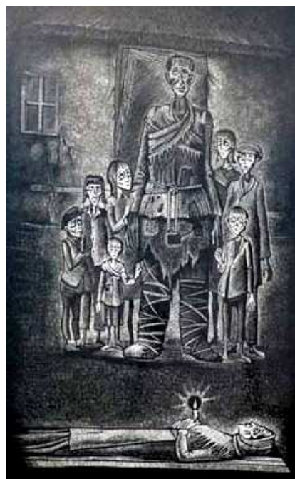
Monument commémoratif de Sobolivka

Le film s'attachera à replacer le Holodomor dans son contexte historique, de la première famine jusqu'à la deuxième guerre mondiale, en évoquant en outre les purges de 1936-38.