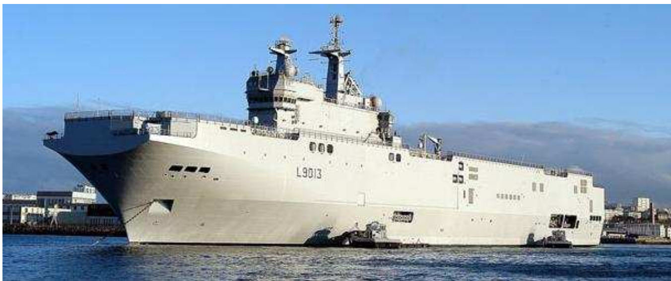
La vente d'un porte-hélicoptères français de classe Mistral (L9013) à la Russie inquiète.

Car il est aussi de l'intérêt de la France de consolider ses relations avec l'autre Europe, celle qui a souffert de l'expansion soviétique dans le passé. Et derrière le problème entre la Russie et la Géorgie, s'en profilent d'autres: celui qui pourrait survenir un jour en Crimée, entre la Russie et l'Ukraine, ou bien encore en Transnistrie, entre la Russie et la Moldavie.