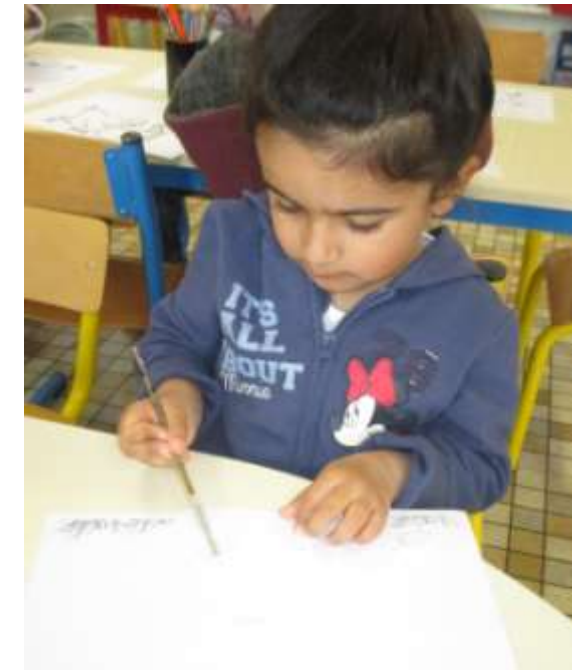
J'ordonne les animaux : du plus petit au plus grand.