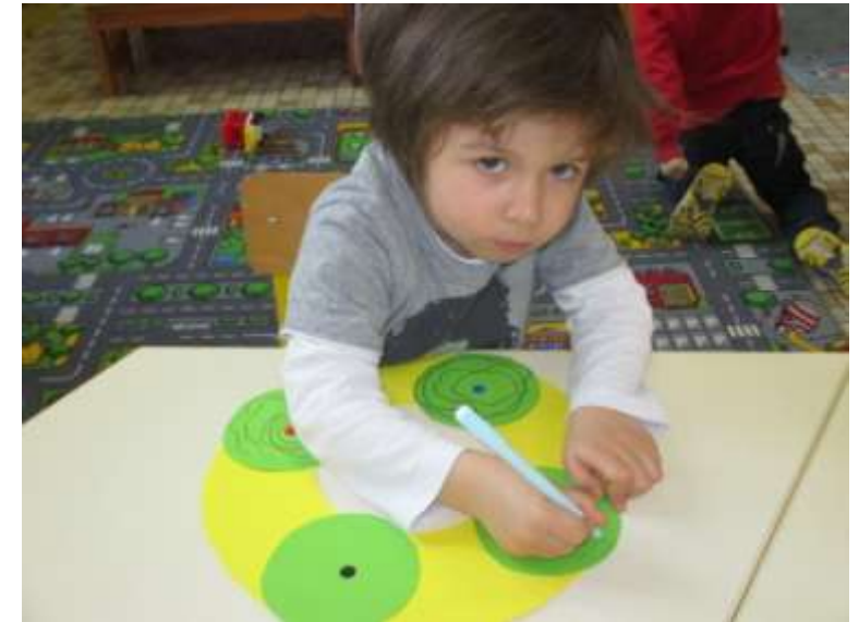
Je trace des ronds à la manière de Kandinsky.