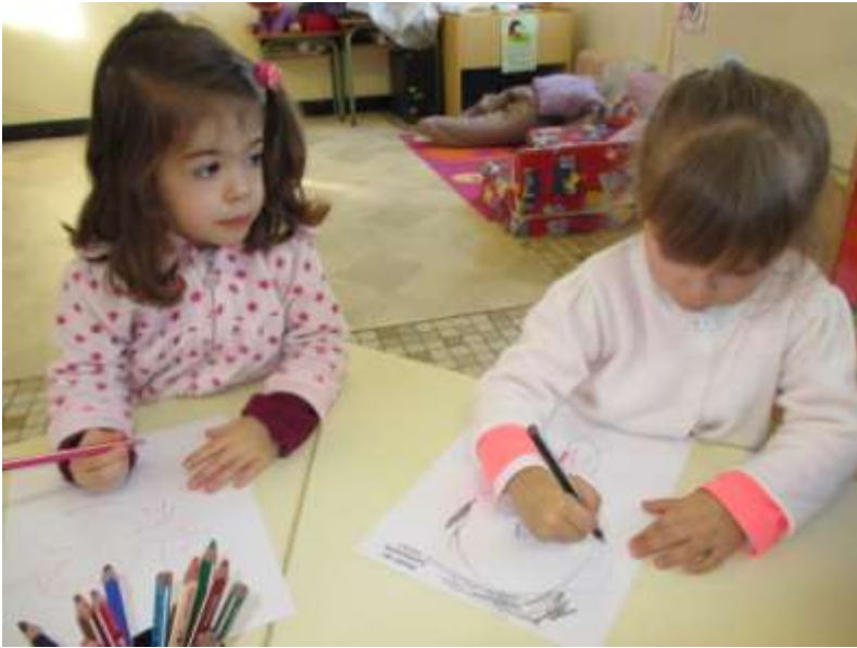
Je dessine un bonhomme (évaluation période 3).