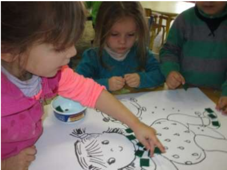
J'utilise divers outils et différentes techniques pour décorer les personnages du carnaval.