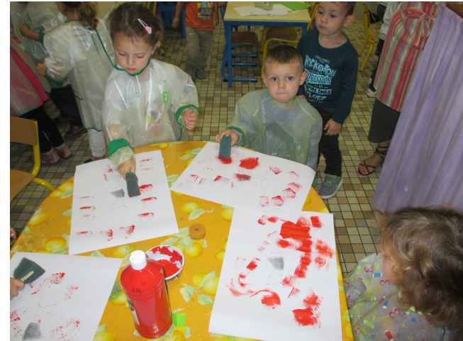
Je fais des empreintes à l'éponge autour de la petite fille en colère.