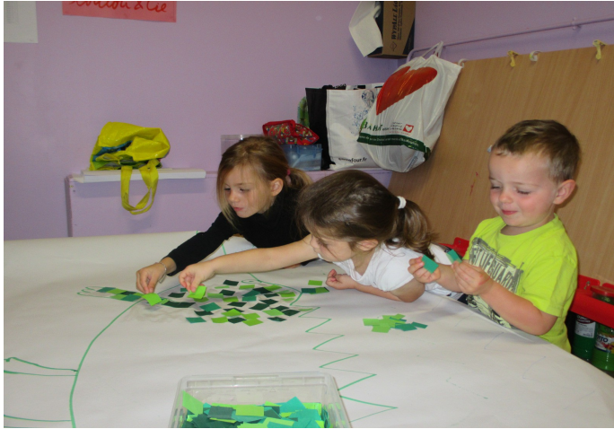
Je colle des morceaux de papier sur le doudou crocodile.