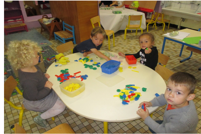
Je trie les objets par couleur.