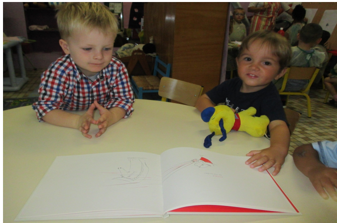
Je raconte l'histoire en m'aidant des illustrations de l'album.