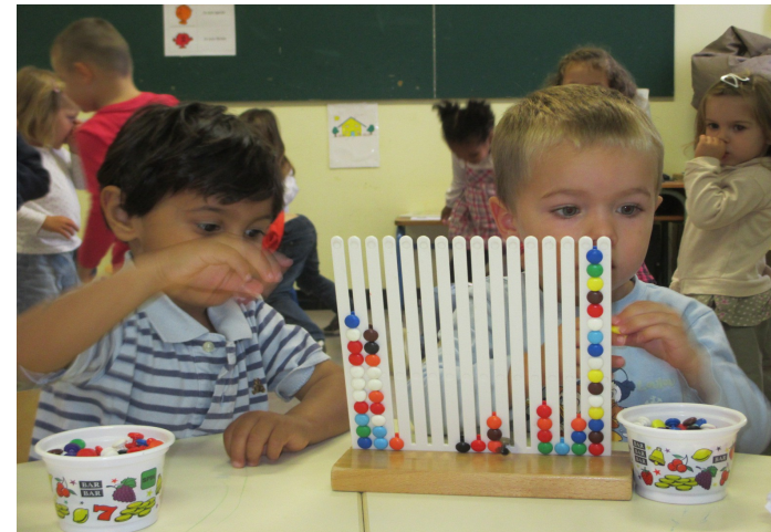
Je joue avec les abaques.