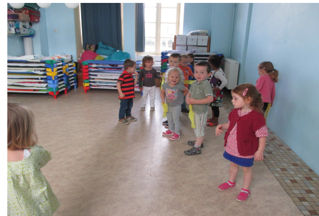
Je cours vite en relais. Je cours pour déposer des objets dans les cabanes. Je joue à attraper les queues des souris.