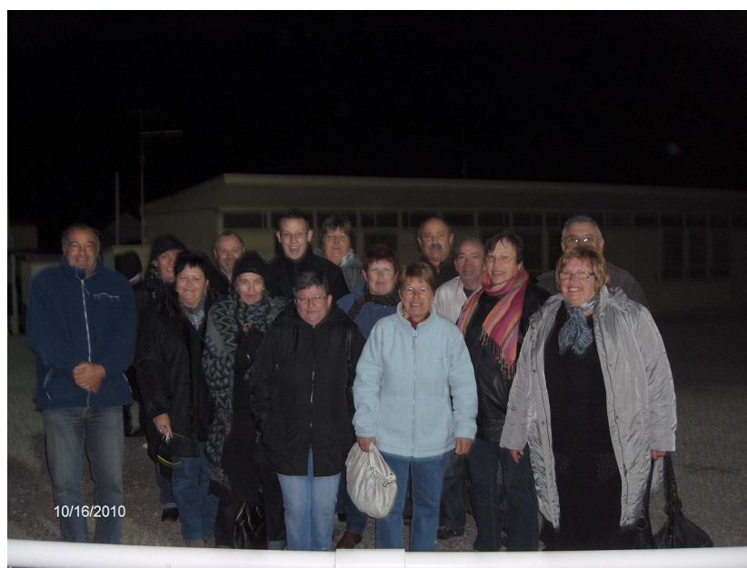
Des fidèles supporters toujours au rendez-vous !