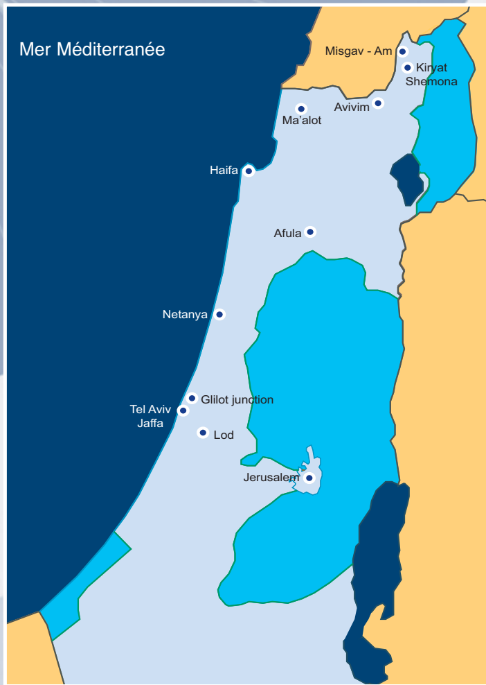
De nombreux attentats palestiniens sont perpétrés en dehors d'Israël