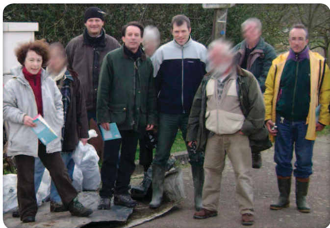
Collecte de déchets avec l'association Tournesol.

Vous aurez peut-être noté, malgré l'étrange absence de photos dans la revue municipale, notre présence dans la plupart des événements qui rythment la vie communale (commémorations, remises de prix et autres récompenses, inauguration de la résidence des Acacias, événements festifs à la résidence des Moissonneurs, implication dans la vie associative, etc.). Vous n'aurez, en tout cas, pas manqué nos diverses communications écrites : tribune dans le journal municipal, site internet ou encore l'opuscule que vous avez entre les mains et dont le