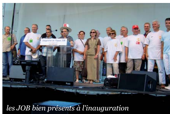
les JOB bien présents à l'inauguration