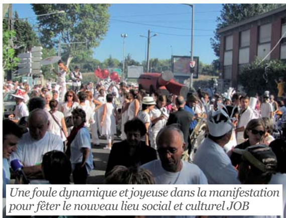
Une foule dynamique et joyeuse dans la manifestation pour fêter le nouveau lieu social et culturel JOB