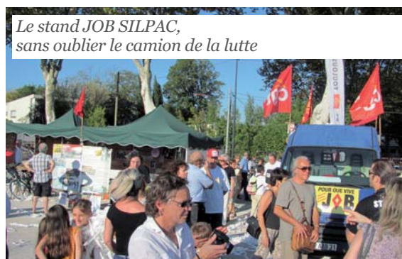
Le stand JOB SILPAC, sans oublier le camion de la lutte