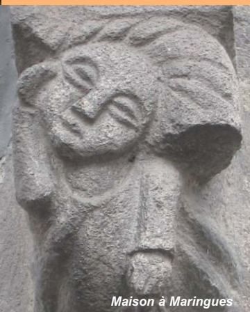
Maison à Maringues