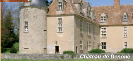
Château de Denone