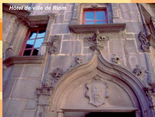
Hôtel de ville de Riom

Office de Tourisme Riom-Limagne, samedi, 9h30-12h30 / 14h-18h et dimanche, 14h-17h. Gratuit. Renseignements : 04 73 38 59 45