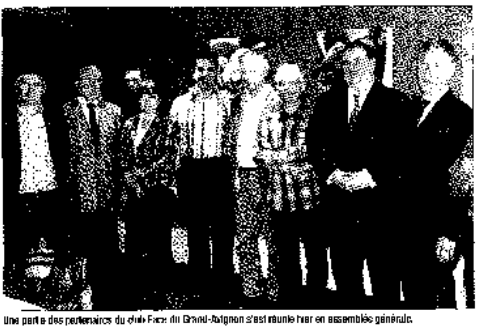
Une partie des participants du club Face du Grand Avignon s'est réunie hier en assemblée générale.

Le club Face du Grand Avignon s'est constitué hier... Le club Face du Grand Avignon s'est constitué hier. C'est une victoire importante pour les habitants du quartier.