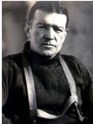
Ernest Shackleton (1874-1922)