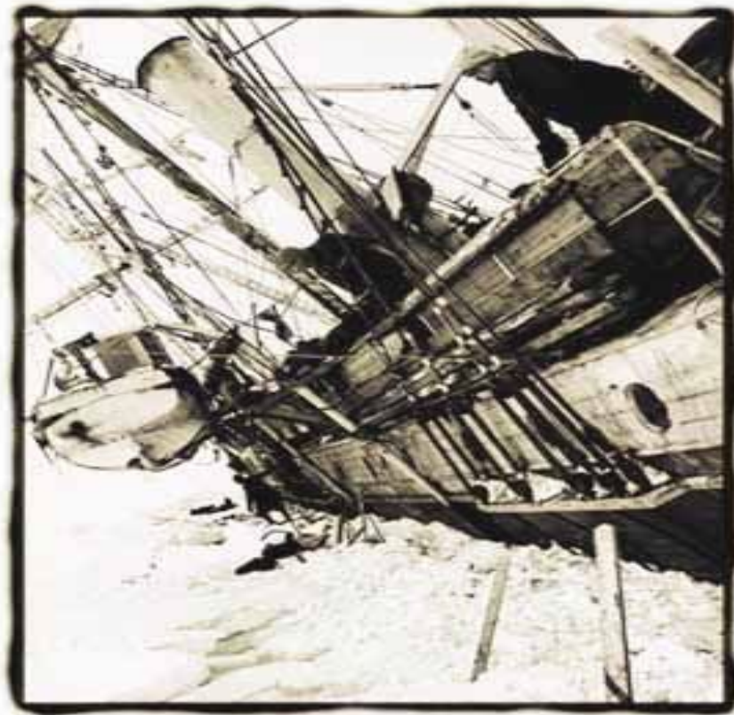
Endurance Antarctica 1915

www.shackleton_endurance.com/posters.html