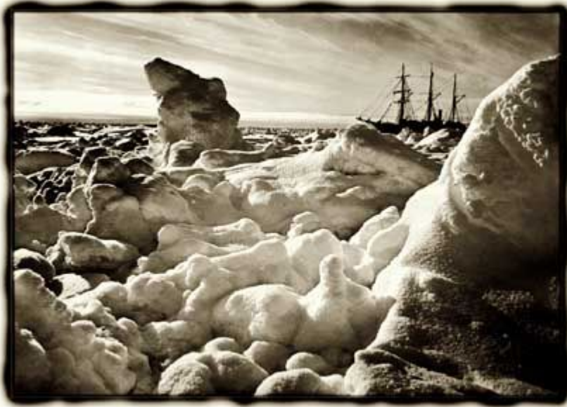
Endurance Weddell Sea Antarctica 1915

L'équipage est bloqué. Les semaines passent et la glace retient toujours le navire dans ses filets.