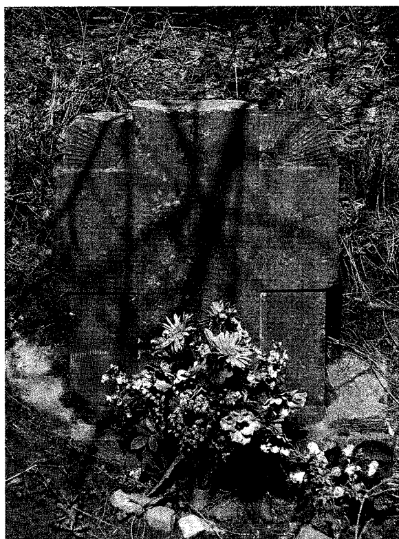
Jamoigne, rue de Bouillon (vers Izel), monument funéraire.