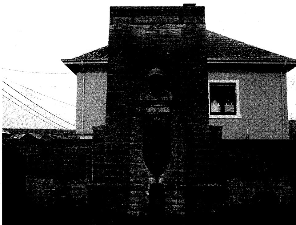
Jamoigne, rue Neuve, monument aux morts.