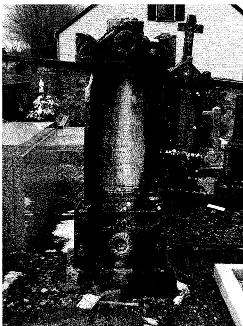
Cimetière de Chiny, la tombe de M. Joseph Camus (+1832)

D'autres tombes du cimetière de Chiny mériteraient notre attention. Elles sont nombreuses aujourd'hui à être abandonnées et à avoir subi les dommages du temps. En voici quelques exemples intéressants du point de vue formel :