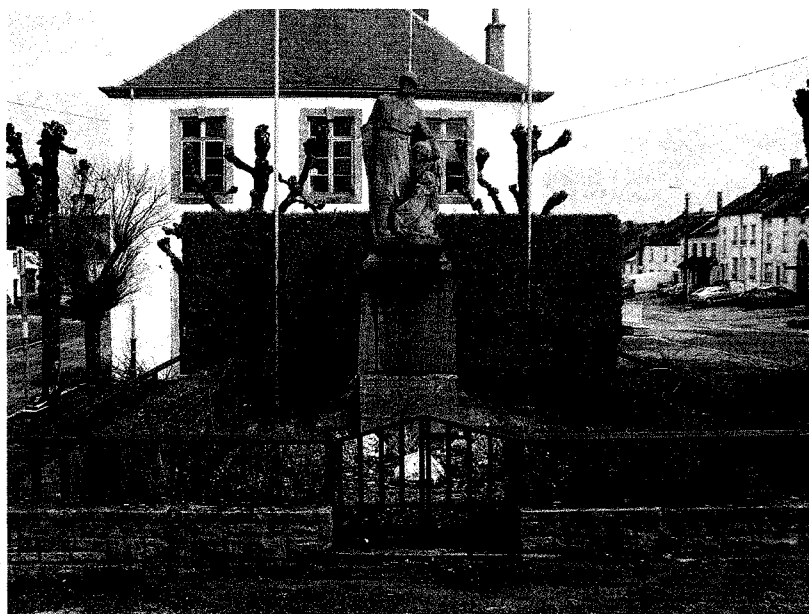
Chiny, Monument aux morts