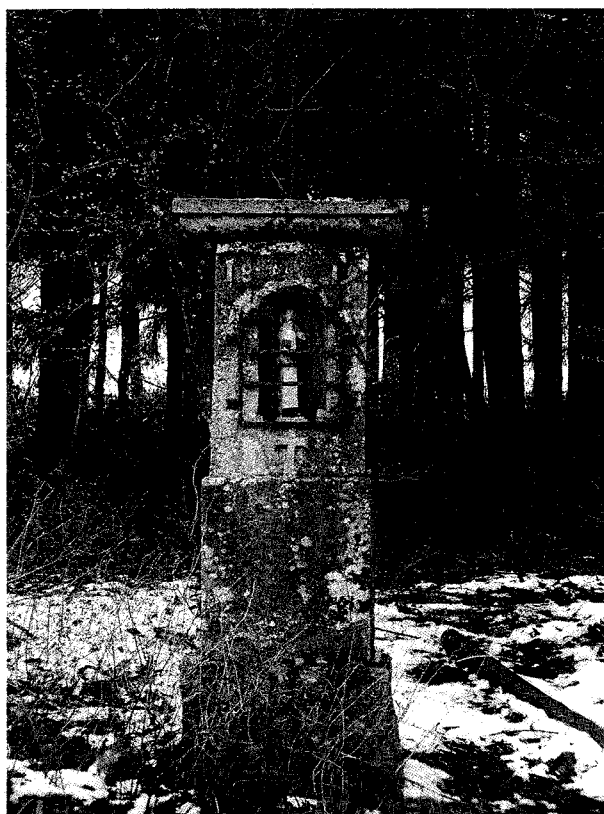
Le long de la R.N.840 entre Izel et Chiny (en face de la ferme de Thiryfays), la Potale Sainte Gertrude.