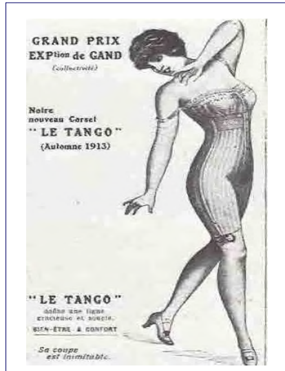
Le nouveau corset «Tango».

La fourrure est très présente dans la mode de la saison automne-hiver : elle double les manteaux, en borde le bas et les poignets, se porte en immenses manchons et même en jupe drapée en plis creux.