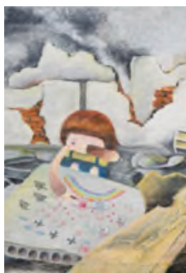
Lu (Chine) "La paix, c'est quand il n'y a pas de guerre et que la solidarité est de mise."

https://www2.lionsclubs.org/p-770-peace-poster-kit.aspx