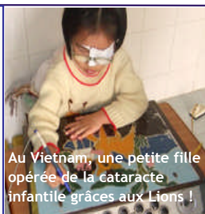
Au Vietnam, une petite fille opérée de la cataracte infantile grâce aux Lions !