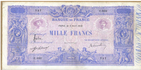
Mille francs avril 1913