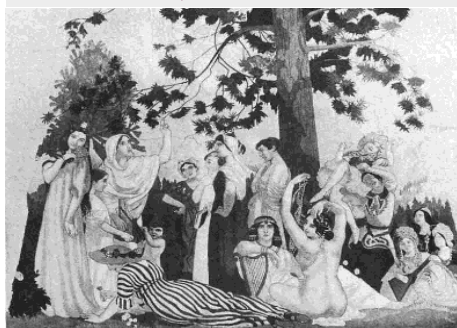
La « renaissance frankiste », première pièce jouée au Théâtre des champs Elysées.