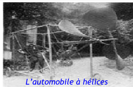
L'automobile à hélices

A une époque où les expériences des hommes volants provoquaient la risée générale, il s'intéressa passionnément aux tentatives de Lilienthal, et, le 30 septembre 1899, sur un planeur de 8 mètres de surface, il se lançait d'un sommet des environs de Genève.