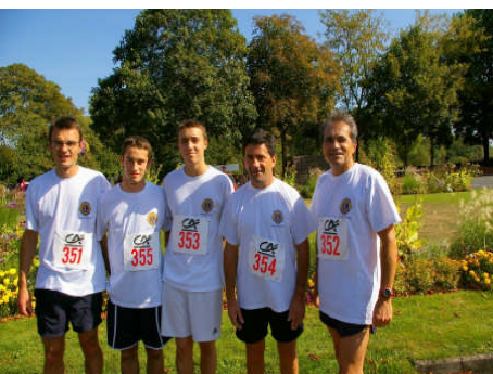
Belle brochette de Lions et consorts....

Pour ce parcours de 5 kilomètres au sein du "vieux MONTAIGU"