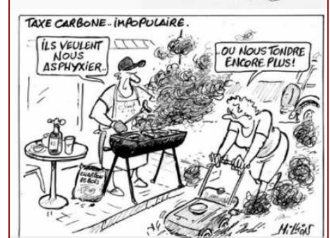
Dessins Yahoo Actualité et Infos-Matin