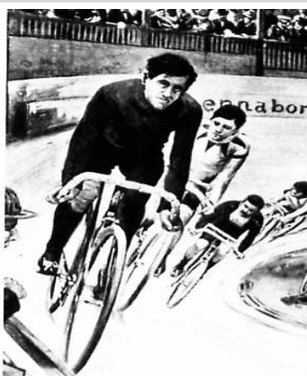
Piste de la course cycliste des Six Jours de Berlin.

15-21 mars. Berlin accueille sur une piste en bois de 150 m la 1 re course cycliste européenne de six jours.