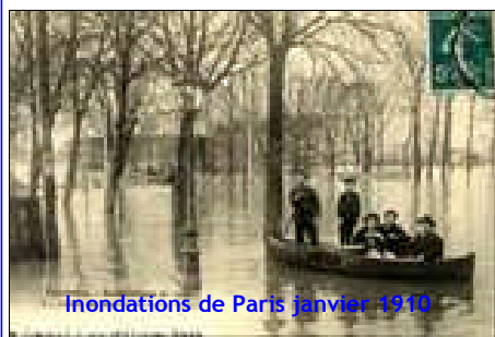
Inondations de Paris janvier 1910