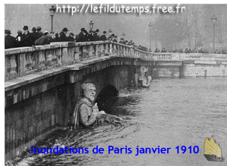
http://lefildutemps.free.fr Inondations de Paris janvier 1910

Dans le hameau de Villeneuve-la-Garenne, dépendant alors de Gennevilliers, on est obligé d'entrer dans les maisons par les fenêtres du 1 er étage.