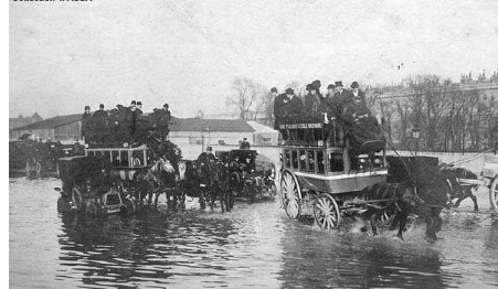
Paris - Esplanade des Invalides - Janvier 1910

Dès le 21 janvier, les avenues de Gennevilliers (avenue de Verdun) et d'Asnières (boulevard Gallieni) sont submergées. Le 26 janvier, les écoles sont évacuées. Dans la nuit du 27 au 28 janvier, les digues sont submergées. Les familles les plus touchées sont évacuées en barques ou en embarcations de fortune. Le 29 janvier, l'inondation est générale. C'est seulement début février que la décrue s'amorce, mais il faudra plusieurs semaines pour nettoyer les boues et débayer les rues des amas de ferrailles et de débris de toutes sortes.