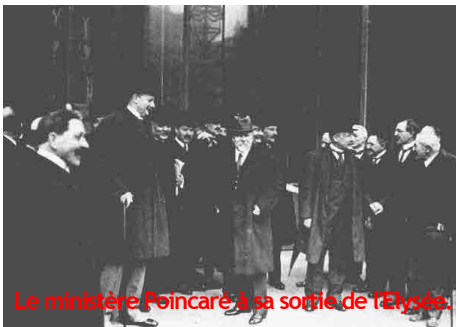
Le ministère Poincaré à sa sortie de l'Élysée.

Bâtonnier du barreau de Paris, il est renommé pour sa puissance de travail et son agilité intellectuelle :