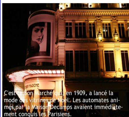
C'est le Bon Marché qui, en 1909, a lancé la mode des vitrines de Noël. Les automates animés par la Maison Decamps avaient immédiatement conquis les Parisiens.