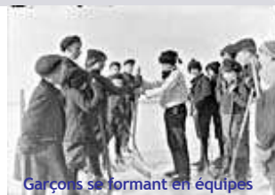
Garçons se formant en équipes pour jouer au hockey à Sarnia Bay (Ontario), le 29 décembre 1908

Autrefois, les joueurs de hockey jouaient sur des étangs et des lacs gelés ou sur des