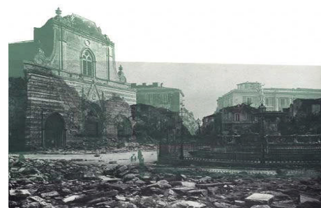
Vue en surimpression de la cathédrale et de la fontaine d'Europe (Italie) avant et après le séisme de 1908

Dans les seules ruines de la ville portuaire de Messine, complètement détruite par la secousse, on déplore 84 000 morts.