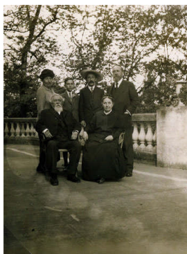
Assis, le Président et Madame FALLIERES

Elle porte des robes à la mode et n'a pas hésité à poser devant les photographes du Journal "L'illustration". Jeanne Fallières, née Bresson, est la femme du Président de la République depuis plus de quarante ans.