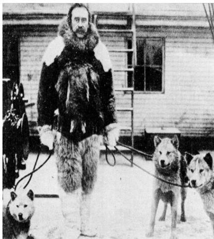
« 15 mars 1909 : Confidences de la femme du Président

Et les résultats ne sont pas négligeables : c'est ainsi qu'en 1895 il a découvert la presqu'île la plus septentrionale du Groenland, qui porte son nom (le Pearyland), et qu'en 1901 il est parvenu à démontrer l'insularité du Groenland.