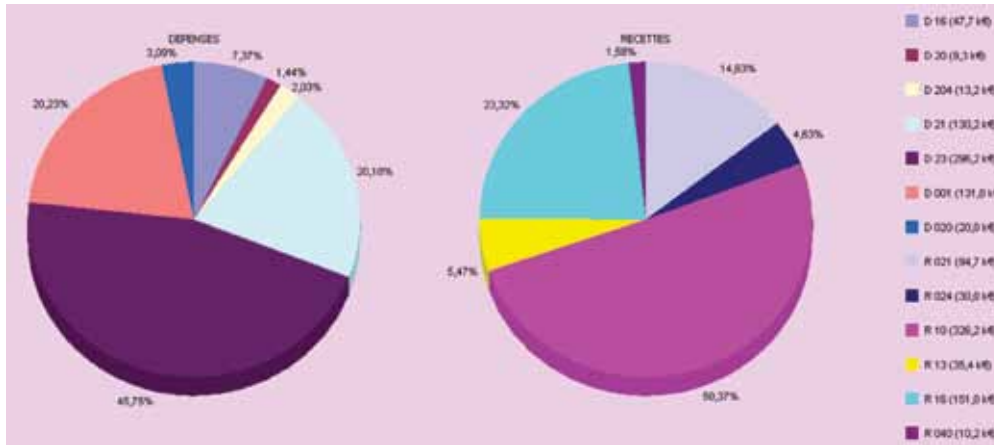
Vue d'ensemble par chapitre d'investissement en dépense et recette COMMUNE DE HEUGAS - 2014

Ce projet, présenté aux responsables de la section Pelote et du Foyer Rural, a recueilli l'adhésion de tous. Début des travaux : 25 août, quatre mois de délai de chantier... et les pelotaris locaux se retrouveront dans leur domaine.