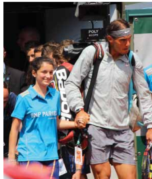
Olaïa à l'honneur ce 8 juin 2014 à Roland Garros...

Exploit suprême, elle aura eu l'honneur d'entrer sur le court lors de la finale main dans la main avec... le vainqueur du tournoi lui-même, Rafael Nadal !