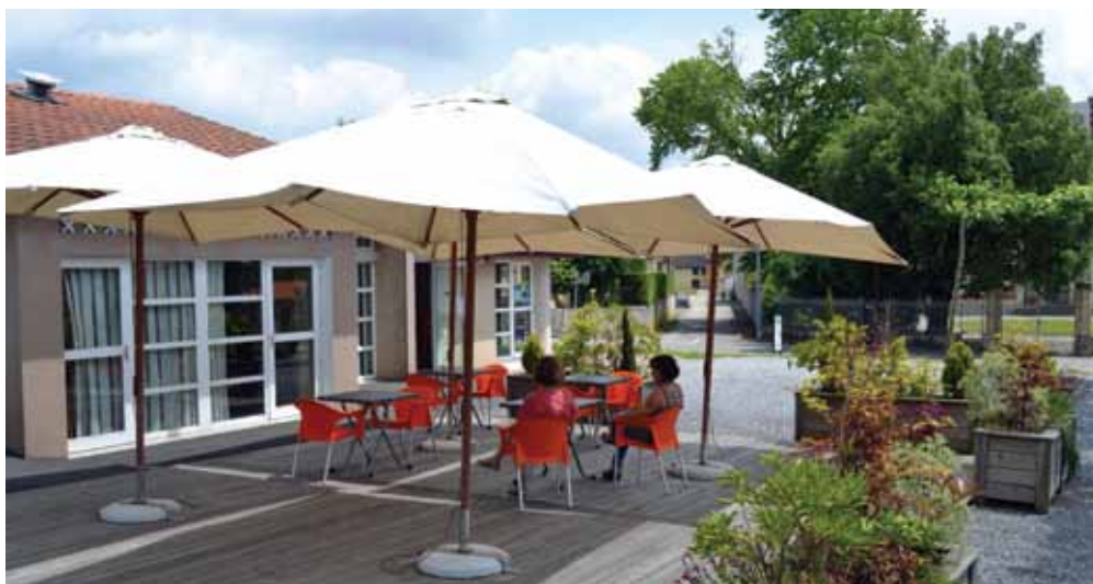
Le restaurant l'Entre-Deux offre un espace terrasse bien agréable lorsque les beaux jours sont là...

« Hormis le bar qui est ouvert dès les premières lueurs de l'aube, Daniel et moi-même accueillons nos clients pour un service de restauration le midi tous les jours de la semaine » explique Fatima.