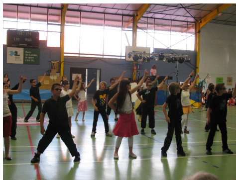
La nouvelle équipe de l'APE