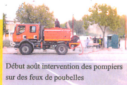
Début août intervention des pompiers sur des feux de poubelles

Actuellement il suffit de regarder les abords de la mairie et les parcs de notre belle cité pour s'apercevoir du relâchement significatif des autorités.