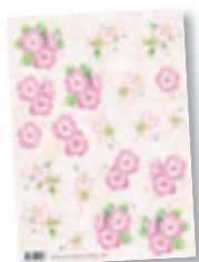
Anne Design VBK 2457