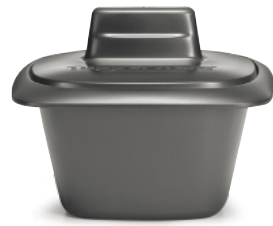
Terrine UltraPro 500 ml

et gagnez un équipement de professionnel !