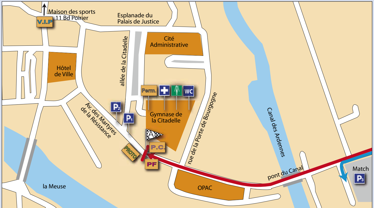
Dimanche après-midi 12/04/2009 - Charleville-Mézières