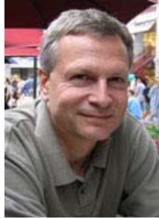
Les indépendants (le fils)