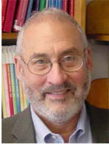
Les indépendants (le père)