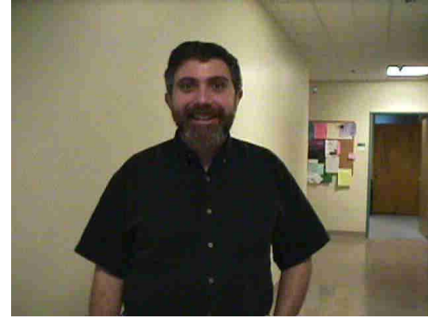
Les réalistes (le fils)