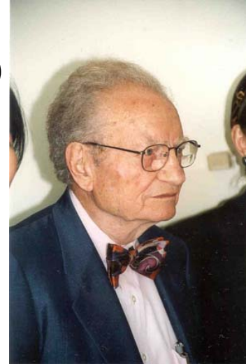
Les indépendants (le grand-père)