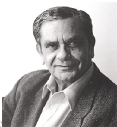
Les dogmatiques (le père)