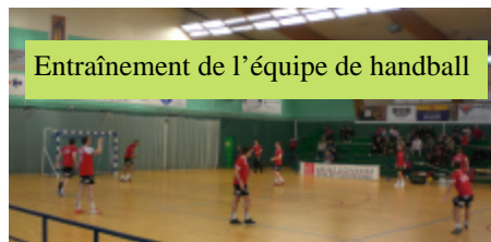
Entraînement de l'équipe de handball