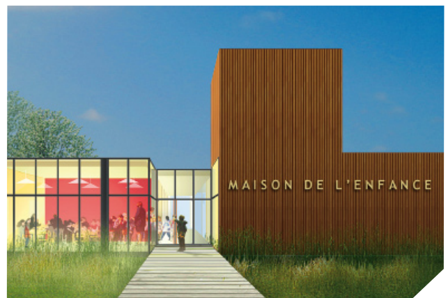
La Maison de la Petite Enfance : une offre de garde sociale et conviviale des petits enfants.