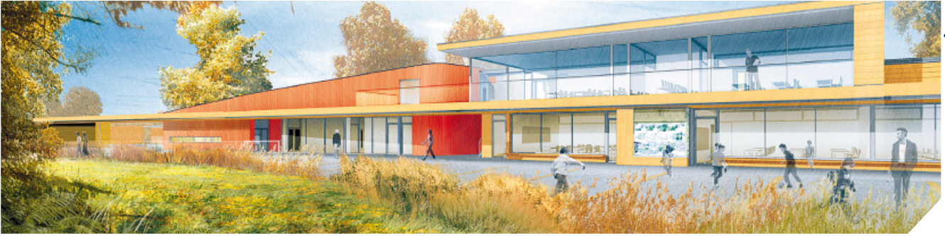
Le Groupe scolaire et le Centre de loisirs accueilleront les enfants à la rentrée 2009.