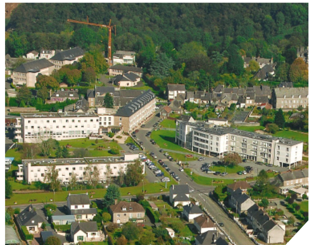
Le projet de Maison médicale sera adossé à l'Hôpital local.