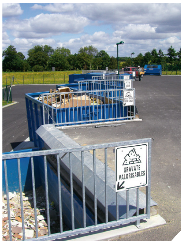
Déchetterie et Plateforme de compostage : un vrai choix environnemental.