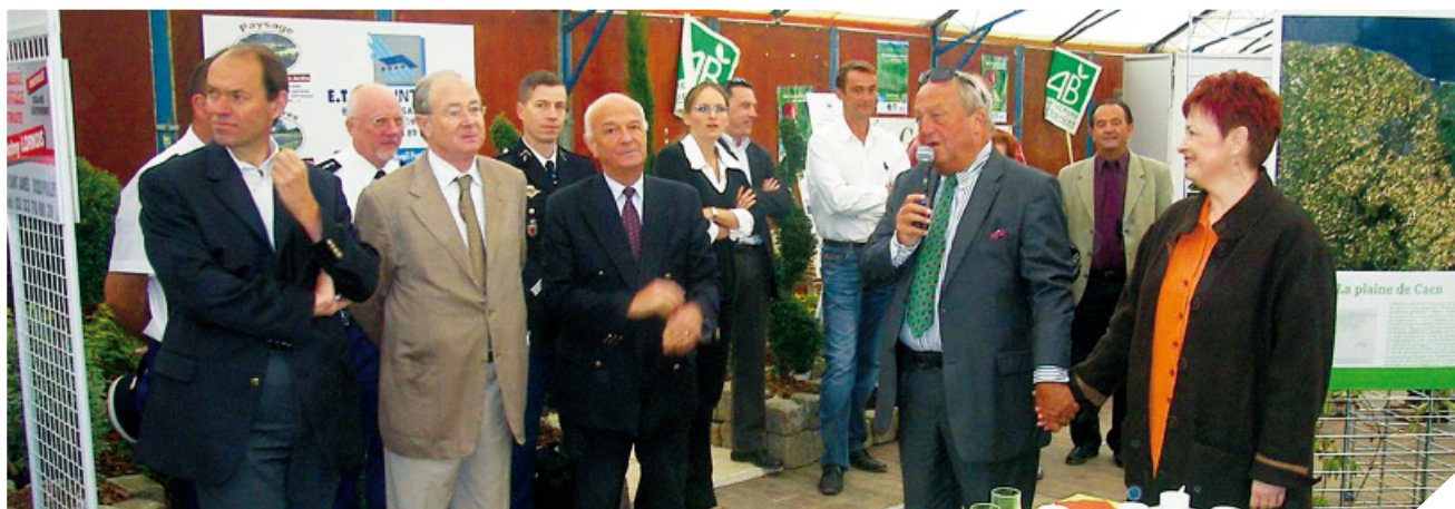
Foire Saint-Macé 2007 : Première édition de l'éco-village.

Création du conseil Municipal Enfants (les prochaines élections auront lieu en Avril).