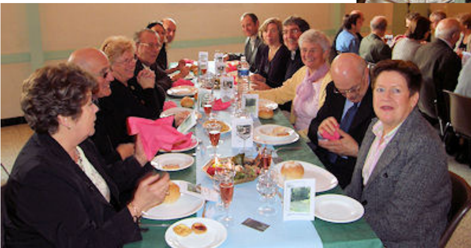
Repas des Aînés.