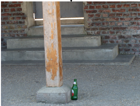
Préau de l'école primaire

Est-ce si difficile de respecter notre environnement ?