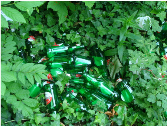
Les abords de l'Omignon

Ces lieux de ralliement sont facilement identifiables par l'amoncellement de canettes de bière laissé à même le sol. C'est d'autant plus regrettable que les containers sont à proximité!