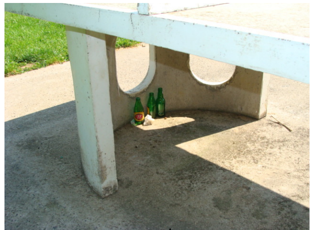
Table de ping-pong au terrain de foot