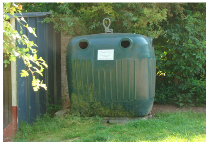
Container au terrain de foot