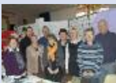
Marché de Noël de YOKIS à Muille-Villette