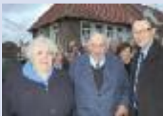
Noces de diamant à Sancourt