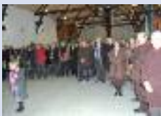
Vœux à Brouchy