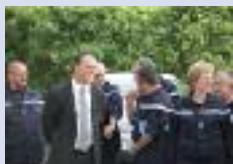
Centre de secours de Ham