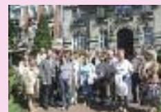
Les journées du patrimoine