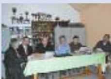
AG du tir à l'arc de Brouchy