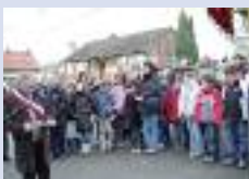
Inauguration du jardin à Sancourt