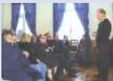
Vœux à Ennemain