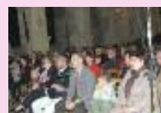
Soirée du Lions club au profit des HAM'is des mots