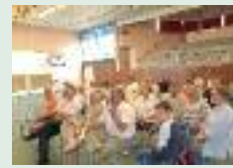
AG des 24h non stop à Eppeville