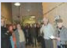
Vernissage de l'exposition sur la Roumanie