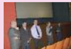
Soirée de courts métrages au cinéma