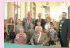
Noces de diamants à Ham