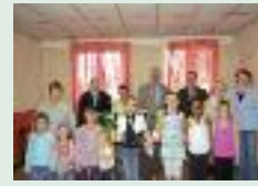
Lâcher de ballons à Ham