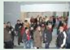
Compétition de basket à Ham