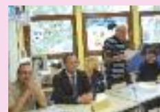
AG du club de scrabble