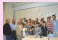
AG du club de triathlon