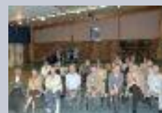
AG du tennis de table de Muille-Villette