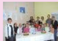
Semaine du goût à la maison de quartier