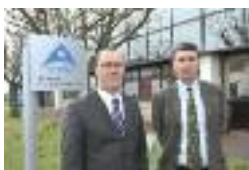
Entreprise ALCAN à Ham