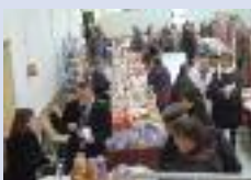
Marché artisanal à Brouchy