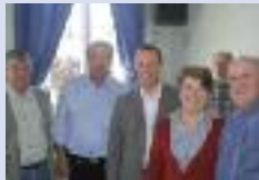
Marché aux fleurs à Ennemain