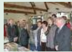
Art et pomme de terre à Offoy