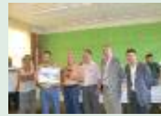
Centenaire des Pêcheurs Hamois