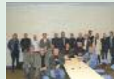
AG des cyclo randonneurs

320 chefs d'entreprises, artisans, commerçants qui participent à leur manière au développement de notre canton. Je souhaite leur apporter mon soutien, celui du Conseil général.