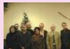
Noël à Y