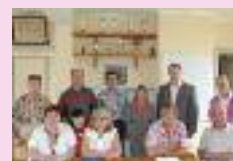
AG du comité des fêtes de Muille-Villette