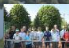
Compétition de tennis à Eppeville