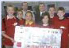
Pentathlon Collège Notre-Dame