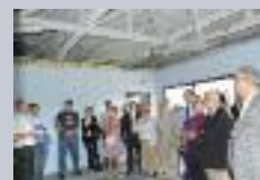
Centre Educatif Fermé à Ham