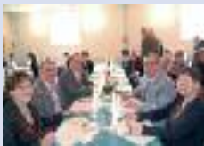
Repas des ACPG-CATM et les Aînés à Monchy-Lagache