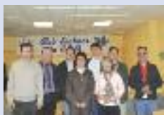
Rencontre d'échecs au centre social