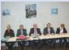
AG comité de quartier Saint-Sulpice/Estouilly