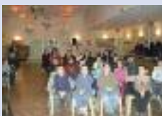
Projection photos à Monchy-Lagache