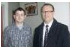
POM ALLIANCE à Ham