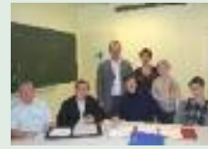
AG du club d'échecs