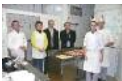
Traiteur MACQUET à HAM

Somme Initiative : 29 rue des trois cailloux 80000 Amiens 03 22 22 30 63