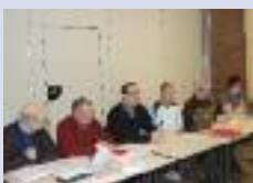
Assemblée générale de la Pétanque Hamoise