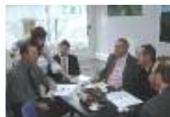
Entreprise GERI à Eppeville

Il leur est aussi difficile de trouver de la main d'œuvre locale qualifiée.