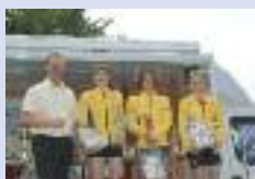
Triathlon à Ham