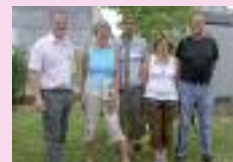
Randonnée avec les Vadrouilleux