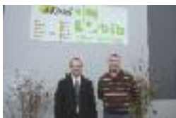
BITZ à Ham