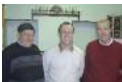
Commerce à Ennemain