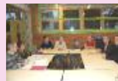
AG de Escal'Ham