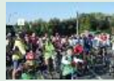
Fête du sport en famille