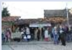
Mobilisation pour l'école à Monchy-Lagache