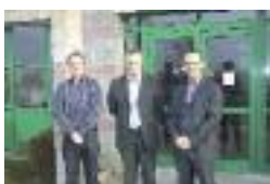
SCREG à Ham