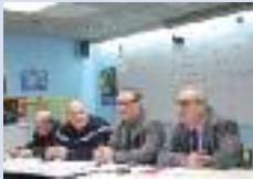
AG de l'amicale des pompiers