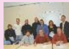
AG de l'U.S. Ham football