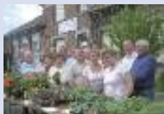
Marché floral quartier Saint-Sulpice/Estouilly