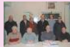
AG des pêcheurs de Monchy-Lagache