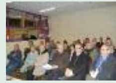
AG du comité jumelage Eisfeld