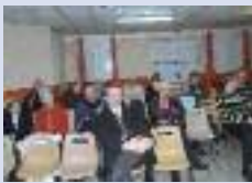
AG des amis du château