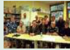
AG du club de scrabble