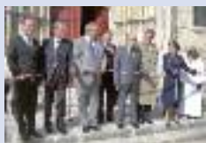
Inauguration du Portail de l'église d'Athies