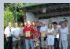
Tir beursault à Eppeville