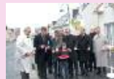
Inauguration de lotissement à Eppeville