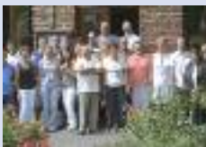
Le 14 juillet à Villecourt