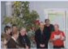
Compétition de tir à l'arc à Ham