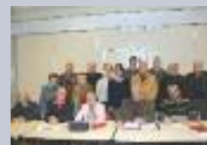
AG des cartophiles de Ham