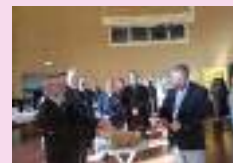
Salon de la philatélie