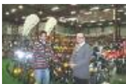
TENDANCE IMPORT à Ham