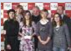
Talent du sport du collège Victor Hugo