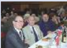
Repas des anciens combattants UNC