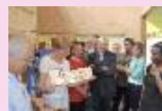
Exposition sur la calligraphie