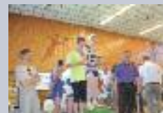
24h non stop d'Eppeville

Jean Clarétie « Tout homme qui dirige qui fait quelque chose, a contre lui, ceux qui voudraient faire la même chose, ceux qui font précisément le contraire et surtout la grande armée des gens beaucoup plus sévères, qui ne font rien ».