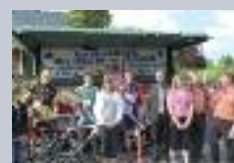
Course cycliste à Sancourt