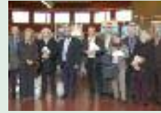
Salon des peintres et sculpteurs Ham