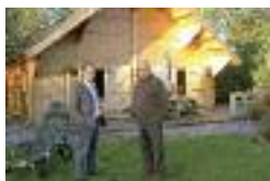
SCI Domaine des îles à Offoy