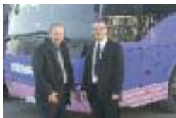
DEWITTE à Ham