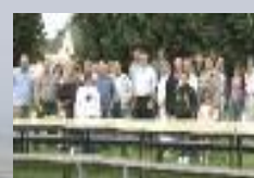
14 Juillet à Devise