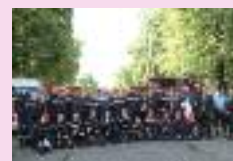
14 juillet du centre de secours