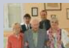
Centenaire à Eppeville