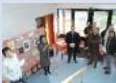
ITEP ET SESSAD projet sur la différence