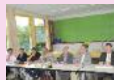
AG du foot ball club hamois