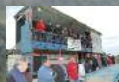
Compétition du RC97 à Matigny