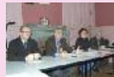
Réunion pour le tour de Picardie cycliste