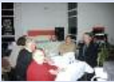
Champions pour le Pays de Somme à Sancourt