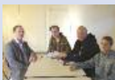
AG de l'association abracadabr'HAM