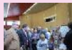
Salon des parents à Ham