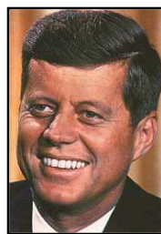
KENNEDY (1917-1963) Président des Etats-Unis de 1961 à 1963