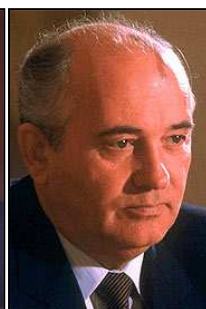
GORBATCHEV (1931) Dirigeant de l'U.R.S.S. de 1985 à 1991, met fin à la « guerre froide »