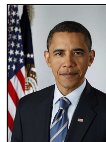
BARACK OBAMA (2009-) 44 e président des États- Unis d'Amérique