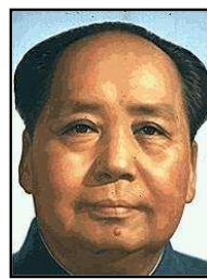
MAO ZEDONG (1893- 1976) Dirigeant de la République populaire de Chine de 1949 à 1976