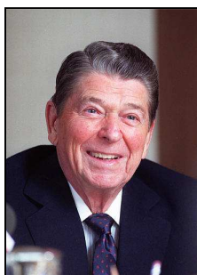
REAGAN (1911-2004) Président des Etats-Unis de 1981 à 1989