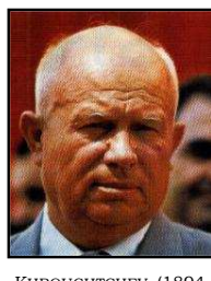
KHROUCHTCHEV (1894- 1971) Dirigeant de l'U.R.S.S. de 1955 à 1964