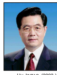
HU JINTAO (2003-) 8 e président de la République populaire de Chine