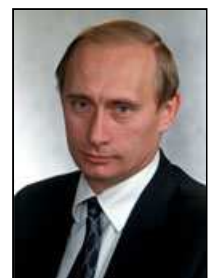
POUTINE Président de la Fédération de Russie de 2000 à 2008 7 e et 11 e président du gouvernement russe (depuis 2008)