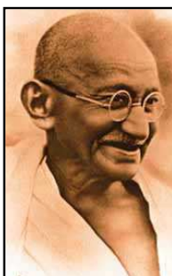
GANDHI (1869-1948) Chef pacifiste indien initiateur de l'indépendance de l'Inde