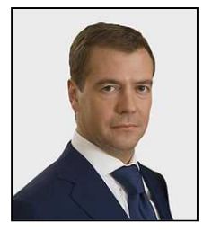
Dmitri Medvedev 3 e (2008-) président de la Fédération de Russie