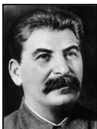
STALINE (1879-1953) Dirigeant de l'U.R.S.S. de 1928 à 1953