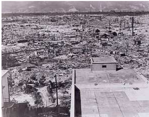
Dégâts dans le centre de Hiroshima suite à l'onde de choc, au souffle et aux incendies.