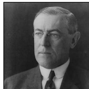
WILSON (1856-1924) Président des Etats-Unis