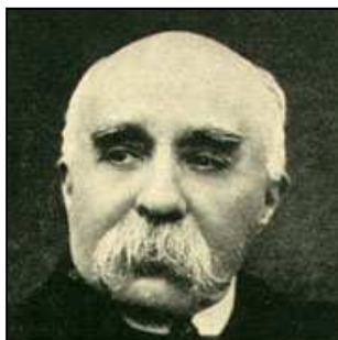
CLEMENCEAU (1841-1929) Président du Conseil des ministres