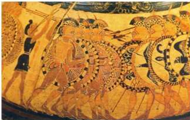
La phalange d'hoplites est constituée de fantassins lourdement armés protégés par leurs boucliers. Au combat, les hoplites avancent en cadence, en rangées compactes. Vase grec du VI e siècle avant J.-C., musée national d'archéologie de Naples.

Les sacrifices ayant donné de bons présages, les Athéniens donnèrent le signal de l'attaque.