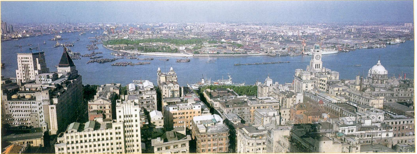
Pudong au début des années 1990.